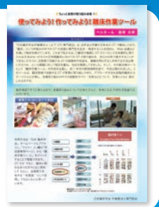
写真1枚と自慢の文章だけでもOK！レイアウト自由で、病院のユニークな取り組み、働き方改革、院外での活動など、皆さんがちょっと自慢した取り組みをアピールしてください。